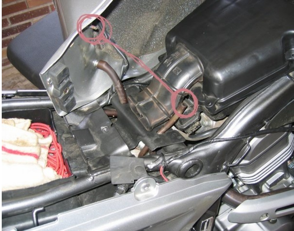
OJO CON LA TOMA DE AIRE DEL DEPÓSITO AL DESMONTAR (gracias metra)